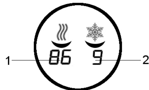
Рис.2 Дисплей аппарата V760C...